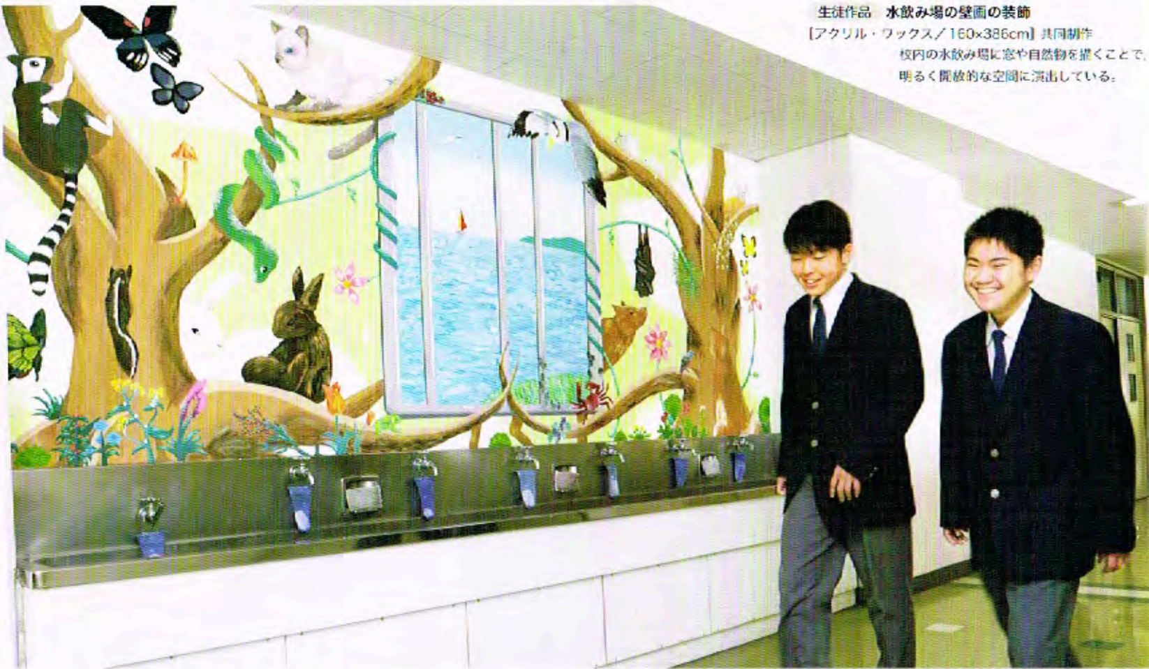
生徒作品 水飲み場の壁面の装飾