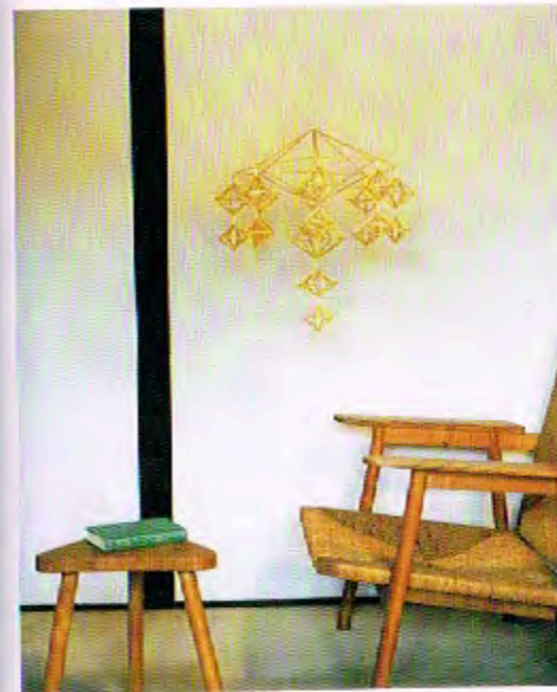
生徒作品 さげもん