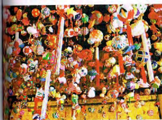
さげもん(ひな祭りのつるし飾り) [福岡県]