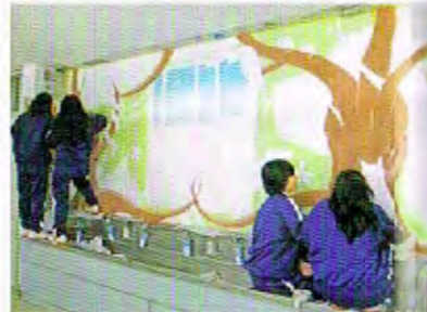
背景や木など面積の広い部分を着色してから、動物などの細かい部分を塗って仕上げていく。